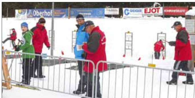
Kampfrichter bei der Arbeit